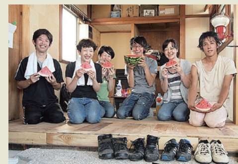
FLAT member's Column

坪田: 私はそんなに仕事が無かったから(笑) ゆったりしたシェアスペースで、お話とかしながら作業してたんだけど、そこで出会った人に素敵な出会いを繋いでもらって、この秋から作家さん達数人と長屋