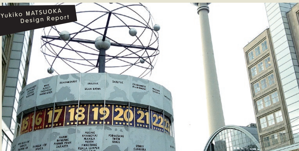
欧州の取材拠点のひとつ、独ベルリン