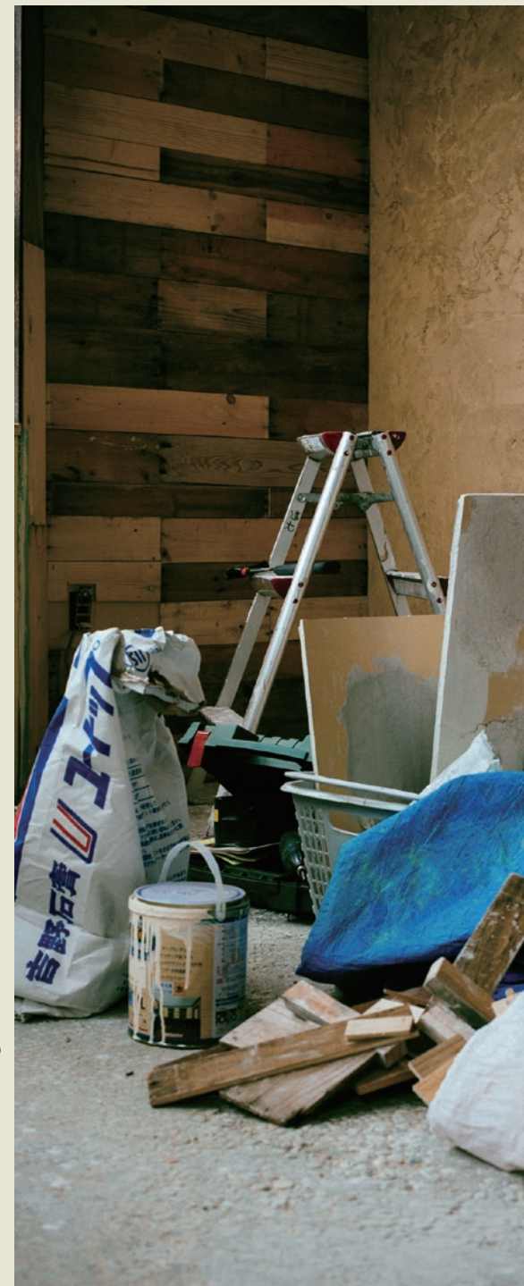
©2013 FLAT. Reproduction of any materials appearing in this free paper is forbidden without prior written consent of the publisher.

特別協賛:藤田製本印刷 www.ftive.com/ デザイン・編集:株式会社ヒュージ www.hudge.jp/